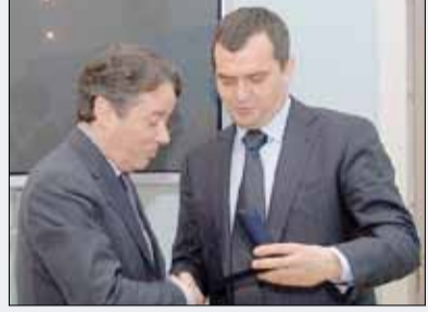
УЗГ МВС України

Міністерство внутрішніх справ розраховує на допомогу іноземних колег, які прибуватимуть до нашої держави та братимуть участь у роботі Центру міжнародного співробітництва, що створюється на базі МВС України. Центр даватиме змогу оперативної отримувати інформацію про ті події, які можуть зацікавити правоохоронців, причому - як на території нашої країни, так і на території Польщі. Співрозмовники також торкнулися питання зростання рівня агресії футбольних уболівальників, адже події, що розгортаються у світі, не дають можливості нехтувати потенціальними загрозами сьогодення. У зв'язку з цим міжнародне поліцейське співробітництво є дуже актуальним, - наголосив Віталій Захарченко. - Нас дуже цікавить досвід французької поліції у сфері забезпечення охорони громадського порядку, безпеки дорожнього руху, діяльності оперативних підрозділів, роботи муніципальної поліції тощо. Я сподіваюся на нашу подальшу плідну співпрацю.