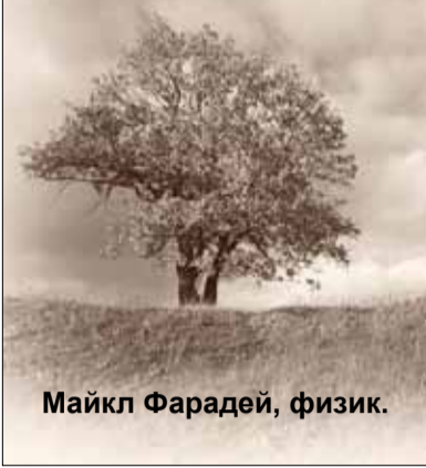
Майкл Фарадей, физик.

Есть, однако, одно счастливое обстоятельство: каковы бы ни были наши мнения, им не изменить и не расстроить ЗАКОНОВ ПРИРОДЫ.