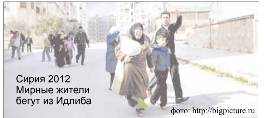
Сирия 2012 Мирные жители бегут из Идлиба