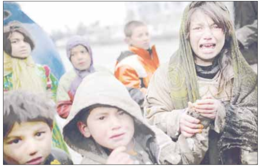
Девочка-беженка плачет: у нее украли талон на продукты, пока она стояла в очереди к грузовику с гуманитарной помощью в Кабуле. Весна 2012.