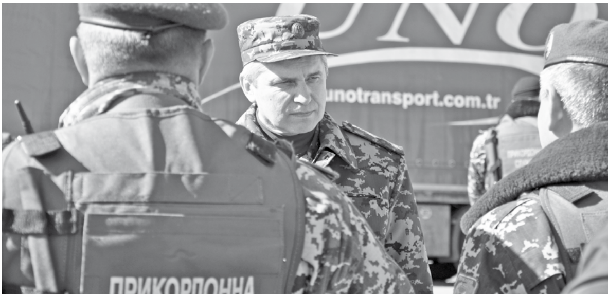
Голова Державної прикордонної служби України генерал армії України Микола Литвин перевіряє готовність підрозділів Східного регіонального управління та резервів до дій в екстремальних умовах і виконання інших завдань.

В рамках інспектування очільник відомства відвідав підрозділи Харківського, Донецького, Одеського прикордонних загонів, а також особисто оцінив обстановку на Північній лінії контролю в межах Херсонської, Миколаївської та Запорізької областей.