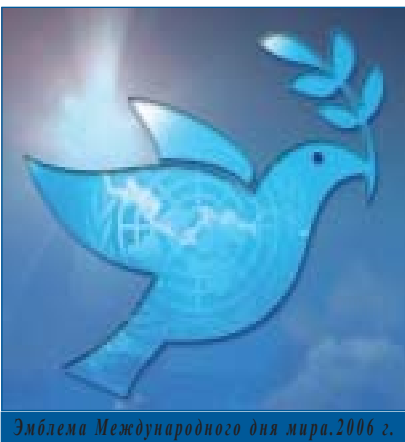
Емблема Міжнародного дня миру, 2006 г.

Голова Ради з питань етнічнонаціональної політики при Президентові України Геннадій УДОВЕНКО